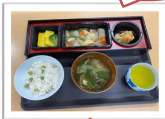
先月は豆ごはんでした♪