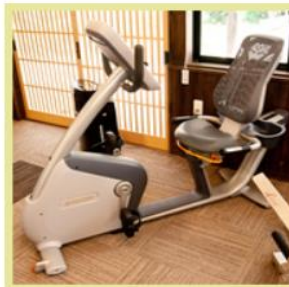
リカベントバイク

軽度認知機能障害ケアを目的としたバイクです。運動しながら脳トレをします。2つのことを同時にするため、より効果的な認知トレーニングが行えます。